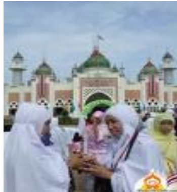
การสลามของศาสนาอิสลาม