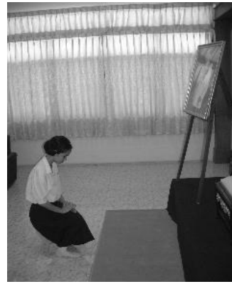
การถวายถอนสายบัว