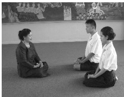
ทำเตรียมกราบ

ทำเตรียมกราบ นั่งพับเพียบ มือทั้งสองประสานกันวางไว้ที่หน้าตัก การกราบ โนมตัวลงกราบลงกับพื้นโดยไม่ต้องแบมือ 1 ครั้ง แล้วดันตัวขึ้นกลับเข้าสู่การนั่งพับเพียบตามปกติ