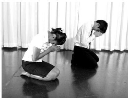
การกราบจังหวะที่ 2 (วันทา)