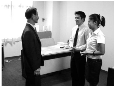
ยืนหน้าผู้มีอาวุโสมาก