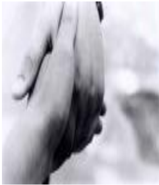
การจับมือแบบชาวตะวันตก