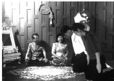
การผ่านผู้ใหญ่ขณะที่นั่งกับพื้น

การเดินผ่านผู้ใหญ่ที่นั่งอยู่ที่พื้น ควรใช้วิธีการคุกเข่าแล้ว เดินเข้าผ่านไป หากเป็นผู้ที่มีอาวุโสกว่ามากต้องใช้วิธีการคลานเข้าแทน