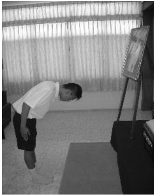
การถวายคำนับ

หญิงถวายถอนสายบัว วิธีปฏิบัติ ยืนตัวตรง ถอยเท้าด้านใดด้านหนึ่งไปด้านหลังตั้งส้นเท้าขึ้น ย่อตัวลงพร้อมกับก้มศีรษะเล็กน้อย มือประสานกันไว้ที่หน้าขา