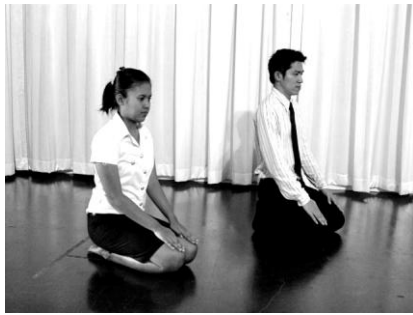
การทำเตรียมกราบ