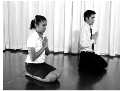
การกราบจังหวะที่ 1 (อัญชลี)