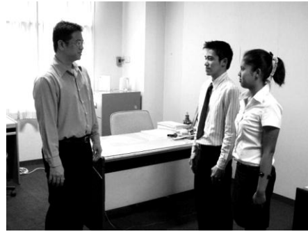
ยืนหน้าผู้ใหญ่