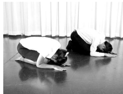
การกราบจังหวะที่ 3 (อภิวาท)

ข. การกราบบุคคล ใช้กราบผู้ใหญ่ที่มีอาวุโส รวมทั้งผู้มีพระคุณได้แก่ พ่อแม่ ครู อาจารย์ และผู้ที่เคารพ ที่มีชีวิตหรือเสียชีวิต ใช้กราบขณะที่ผู้ใหญ่นั่งกับพื้นหรือนั่งเก้าอี้ก็ได้