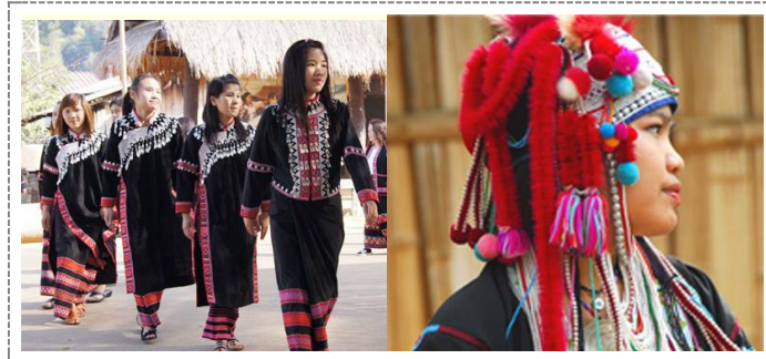
ความแตกต่างทางวัฒนธรรมและชาติพันธุ์ที่สังเกตได้

แต่ถ้าหากว่าปัจจุบันนี้รัฐไม่เคยมองเลย เอาความคิดของตนเองมาเป็นใหญ่ แล้วเวลาที่เกิดเรื่องขึ้นมา ก็มาบอกว่าต้องสมานฉันท์ จะสมานฉันท์อย่างไร แกรมบางคนยังต้องการสันติวิธี สันติสุข ซึ่งความสมานฉันท์นั้นไม่มีแล้วจะมีสันติวิธีได้อย่างไร ( http://tribalcenter.blogspot.com/2011/01/blog-post.html )”