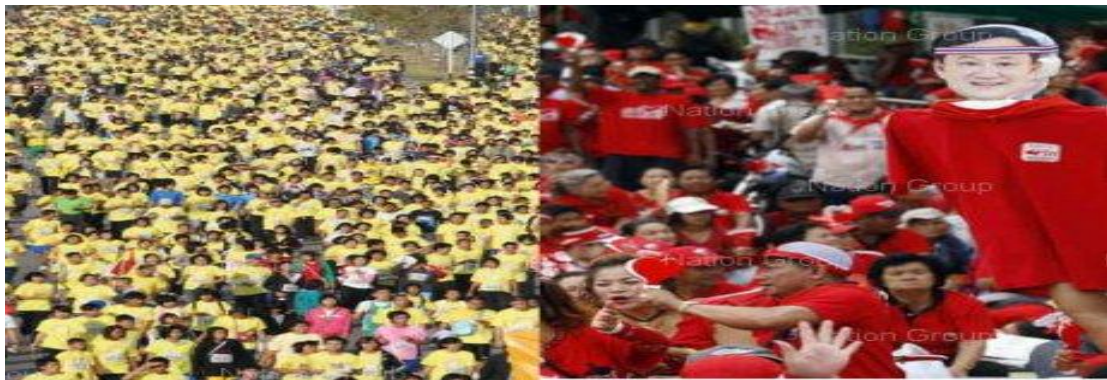
ภาพที่ 1 : ความขัดแย้งระดับชาติด้านอุดมการณ์ทางการเมือง